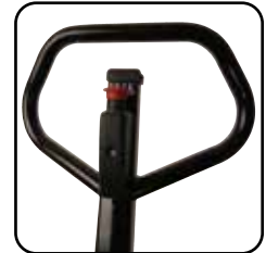
Ergonomisk håndtag giver brugeren et afslappet greb. Mulighed for mærkning af vognen med navn/afdeling.