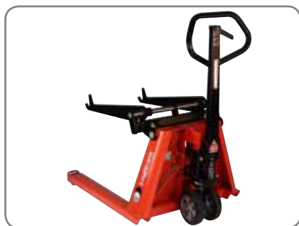
Kompakt, meget manøvreduktig og sikrer brugeren ergonomisk rigtige arbejdsbetingelser.

Stærk konstruktion og lave vedligeholdelsesomkostninger.