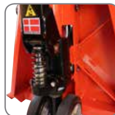
Speciel flowventil giver kontrolleret sænkning og skånsom placering af rullen.