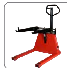
Rulleløfters ben er smalle og korte, så den kan komme helt tæt på maskinen.