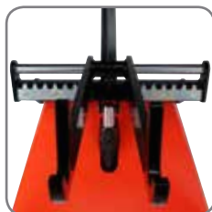
Fleksibelt låsesystem kan nemt indstille Rulleløfters gaffler til forskellige rullestørrelser.