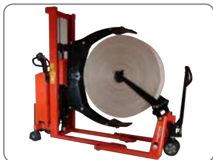
Rulleløfter er en unik partner til Rullerotorator.